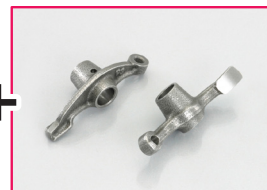
ロッカーアーム SET 商品コード: 303-1133770 税込価格: ¥2,420 本体価格: ¥2,200 JANコード: 4990852086412