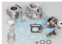
108cc NEW STD ボアアップ KIT (カム付)