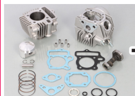
88cc NEW STD ボアアップ KIT (カム付) (Vol.25-1 に掲載)

モンキー/ゴリラ (FNo.Z50J-1600008~1805927/適合車種 B) に装着する場合