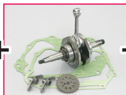
サポート SET 商品コード: 219-1133100 税込価格: ¥37,400 本体価格: ¥34,000 JANコード: 4990852086405